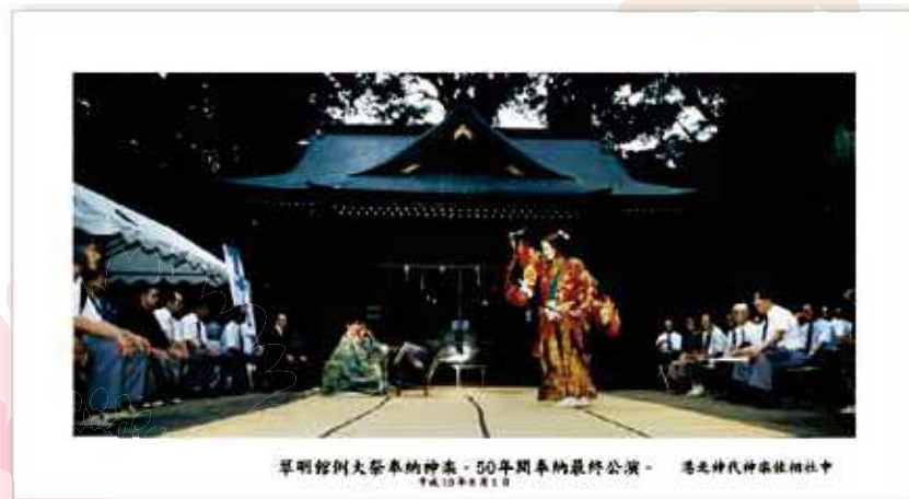
早明館別荘奉納の神楽・50周年奉納最終公演 - 港北神代神社奉納相社中 平成10年8月2日

デジタル化したデータを商品と一緒にお届けします 劣化の心配がなく、家庭プリントもできます